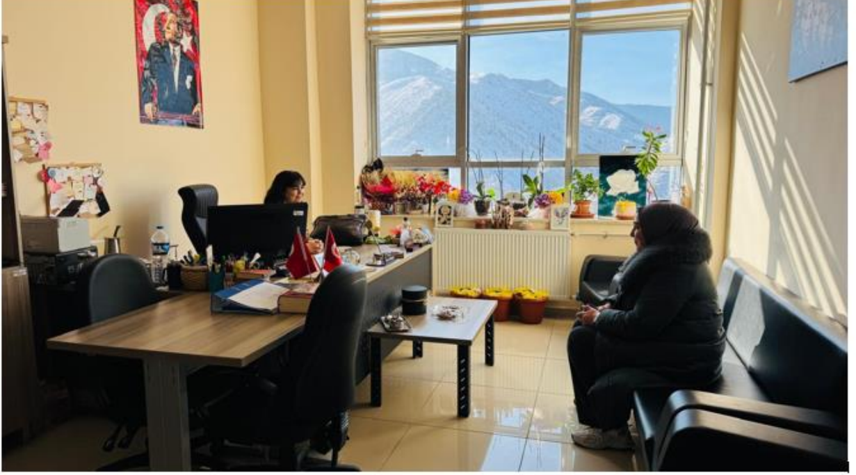
EK 1. DANIŞMANLIK FOTOĞRAFI